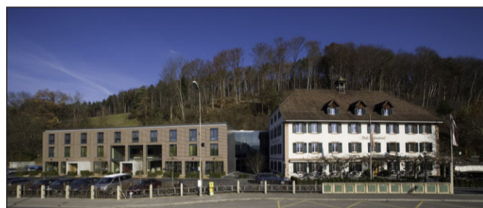
Bad Bubendorf: Denkmalgeschütztes Haus mit modernem Anbau.

Am Anfang war eine Heilquelle. Diese wurde 1641 erstmals urkundlich erwähnt. An die Scharen, die der Solebäder wegen im 19. Jahrhundert nach Bad Bubendorf pilgerten, erinnert noch ein Gemälde im Restaurant des heutigen Hotels Bad Bubendorf. Inzwischen bietet der Ort zwar keine Badekuren mehr – man hat sich eher auf genussvolle «Kuren» fürs Gaumen und Gemüt verlegt.