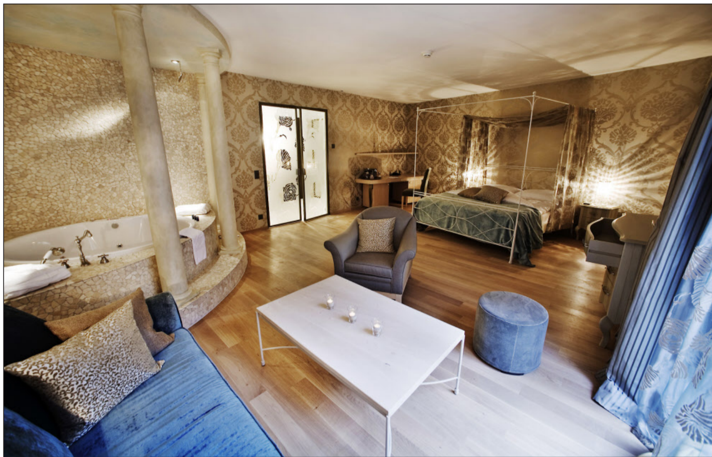
Die beiden Suiten «Cristallo» und «Platino» bieten auf 64 und 70 Quadratmetern hohen Komfort, viel Design und auch Überraschung.