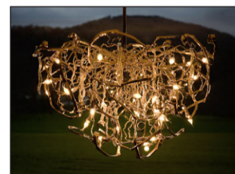
Sanftes goldenes Licht für grosse Momente.