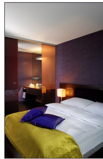
Stylish: Die Zimmer im neuen Anbau des Hotels.