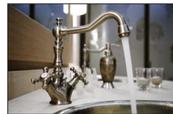
Moderne Badezimmer mit antikem Flair.

So liess er die Geschichte des historischen Ortes von Künstlerinnenhand auf die Wände des Neubaus schreiben, mit Pinsel und Farbe, drei Monate brauchte sie dafür.