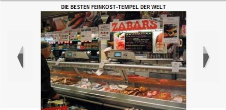
Citarella, Dean & Deluca, Balducci's sind nur einige der Feinkosttempel New Yorks. Zabars ist eine Institution. Ein uraltes, jüdisches Delikatessen-Geschäft an der Upper West Side, das sich immer noch in Familienbesitz befindet

In der Fotogalerie zeigen wir Ihnen davon einige.